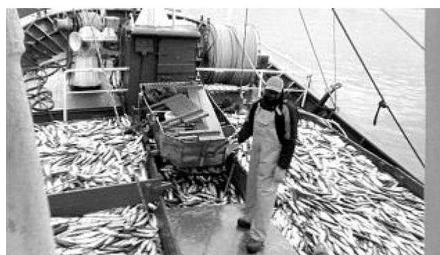
Xardas en la cubierta del «Nueva Emperatriz», en el Puerto de Santoña.

La flota de cerco del Cantábrico-Noroeste, que cuenta en Asturias con cinco barcos, exigió ayer en Santoña (Cantabria) una reunión «urgente» con la ministra de Medio Marino, Elena Espinosa, para abordar la «grave» situación del sector, una vez agotada la cuota de xarda (verdél) asignada este año a los barcos de bajura. Las embarcaciones permanecerán amarradas hasta que se produzca el encuentro.