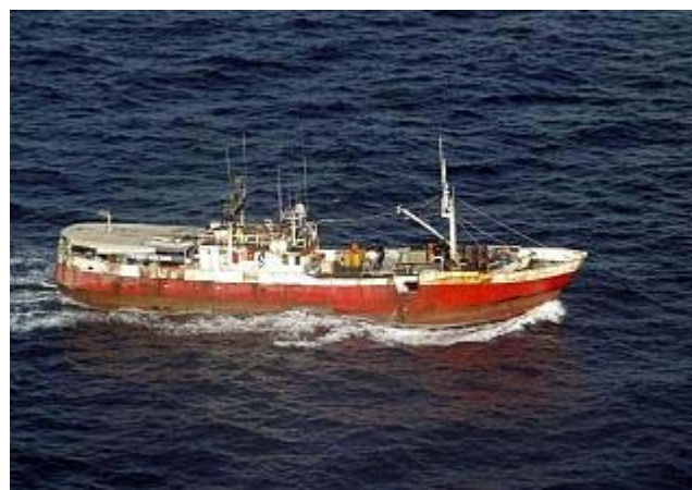
Imagen del 'Sakoba' captada por los efectivos de la 'operación Atalanta'.

El propio ministro de Exteriores, Miguel Ángel Moratinos, confirmó ayer que el embajador español en el país africano -donde está ubicada la armadora del buque secuestrado, East Africa Deep Fishing- había podido hablar ya con el ministro de Exteriores de Kenia sobre el secuestro y que aunque el caso del Sakoba no es similar al del Alakrana, "como en todos los casos en los que un español se encuentre en una situación así, el Gobierno le prestará toda la asistencia consular necesaria para lograr su liberación".