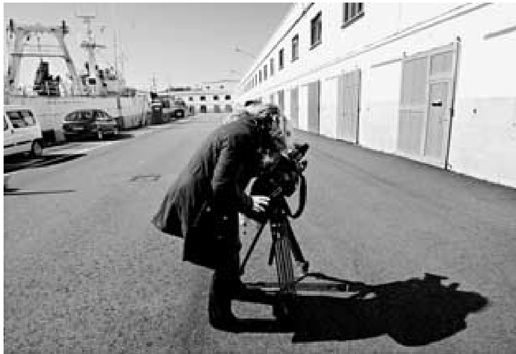
Las capturas del «Sakoba» se comercializan a través de una empresa —en la imagen— del puerto de Vigo

Según confirmó el Ministerio español de Asuntos Exteriores y Cooperación, el embajador en ambos países, quien ya participó en las negociaciones de las libe-